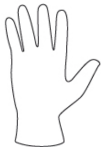
INDOSSARE IL GUANTO INCLUSO NELLA CONFEZIONE