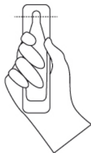
TAGLIARE SEGUENDO IL SEGNO TRATTEGGIATO