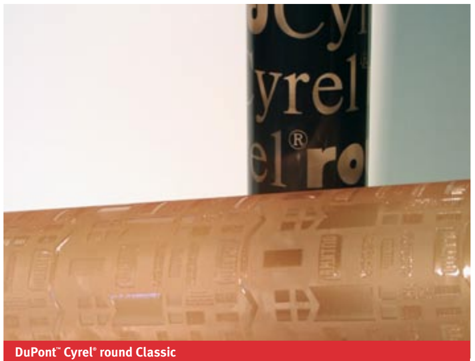
DuPont™ Cyrel® round Classic