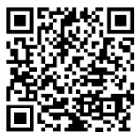
Scarica l'ultima versione

DuPont Packaging Graphics continua ad essere un leader tecnologico a livello mondiale nello sviluppo e nella fornitura di sistemi per la stampa flessografica. Il nostro team di ricerca e sviluppo continua a sviluppare soluzioni innovative per aiutare i nostri clienti ad espandere il proprio business sfruttando nuove e proficue opportunità nel crescente mercato dell'imballaggio flessibile. L'offerta di prodotti comprende le lastre fotopolimeriche Cyrel® ( analogiche e digitali), le attrezzature Cyrel® per la realizzazione delle lastre, le maniche Cyrel® round , i sistemi di montaggio delle lastre Cyrel® e il rivoluzionario sistema termico Cyrel® FAST .