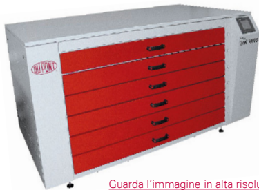
Guarda l'immagine in alta risoluzione

Forno a sei cassette–Attrezzatura allo «Stato dell'Arte»