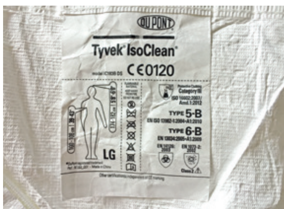
Figura 1. Esempio di prodotto dotato di marchio CE e documentazione

Standard di qualità per il Servizio di farmacia oncologica, European Society of Oncological Pharmacy, Amburgo 2014.